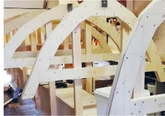
↑ Veneen muotokaaret on asennettu ja tästä lähtee sen kasaus käyntiin.